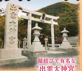
縁結びで有名な "出雲大神宮"

各地(7:10~8:00)~出雲大神宮(参拜)~ 八光館(昼食)~豆屋黒兵衛(ティータイム) ~各地(17:25~18:10)