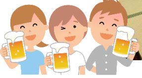
楽しいお酒で意気投合