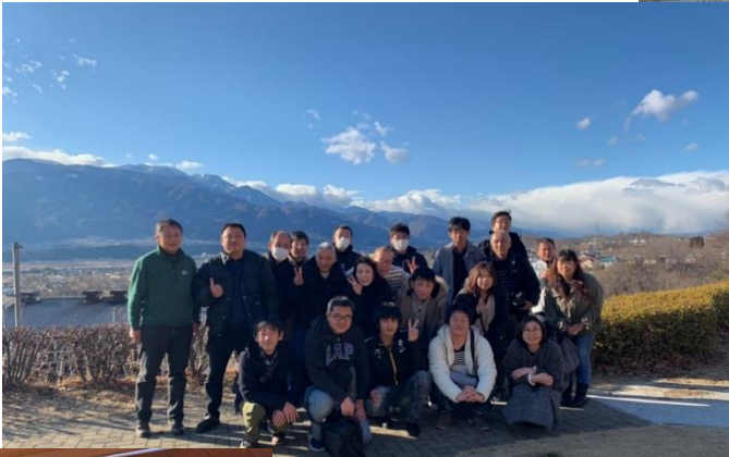
みんなで楽しくハイポーズ