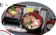
※ 写真はイメージです。