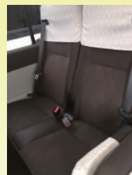
広々ハイバックシート 3点式シートベルト 低反発クッション