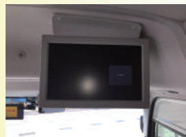
17.5インチのディスプレイ